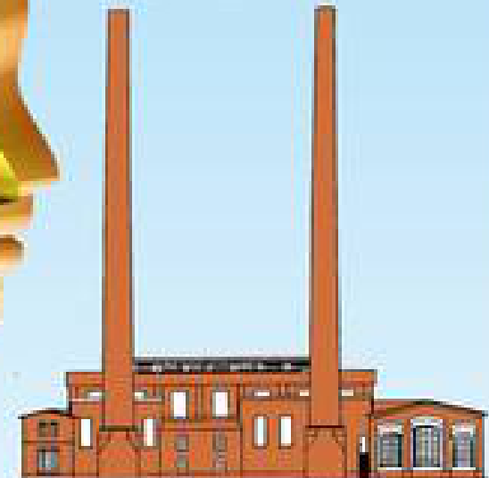
Museum Kesselhaus Herzberge e.V.